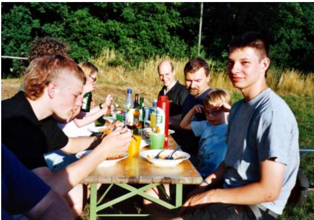
- Essen an der Hase -