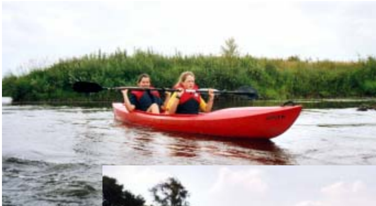
- Wasserspiele -