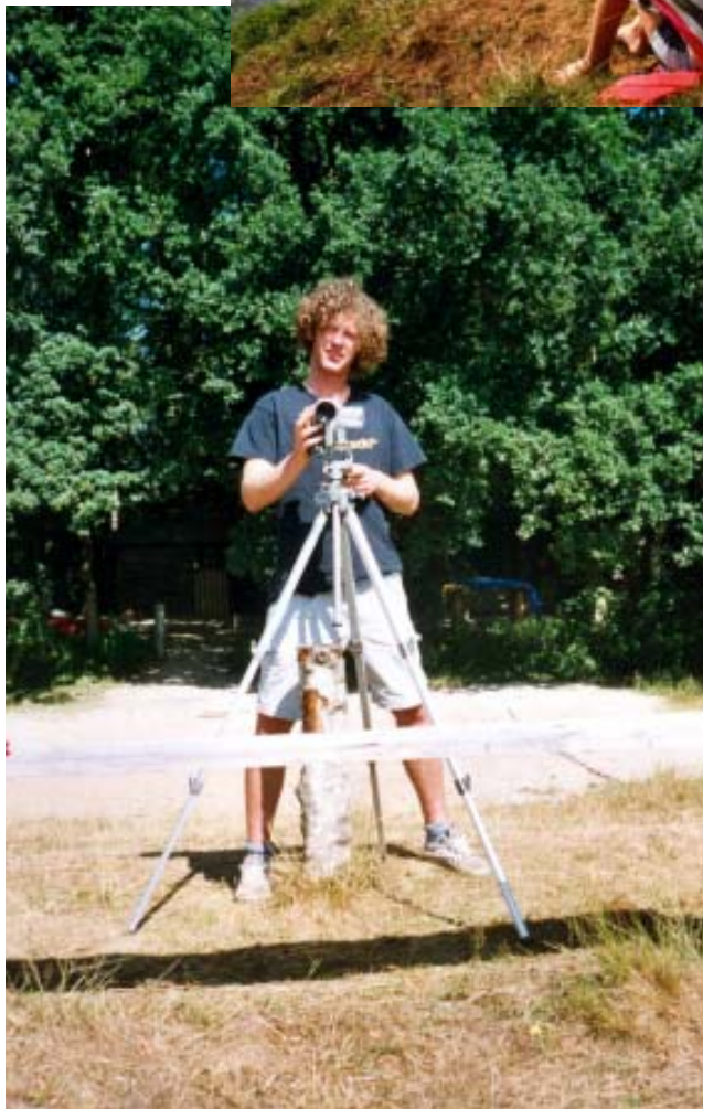
- Der Kameramann -