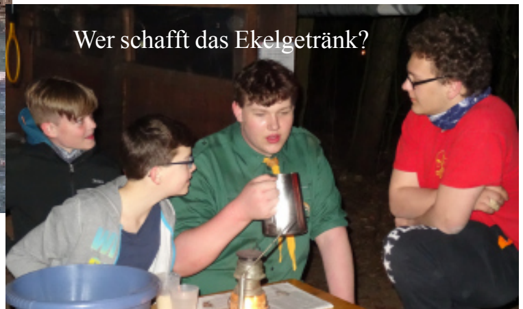
Wer schafft das Ekelgetränk?