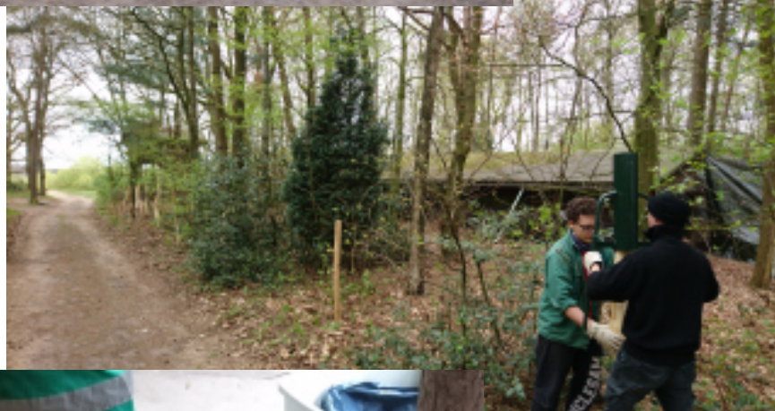
Das unermüdliche Zaunteam: Torben und Mika