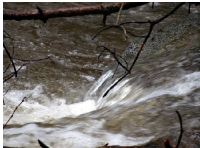
Strömung am Wehr

auch ein Biber untersuchte die überschwemmten Weiden am Weg zur Kolpingwiese. Uwe gelang hier ein seltener Schnappschuss.