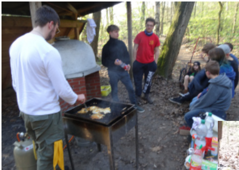
Spiegeleier braten in Gesellschaft