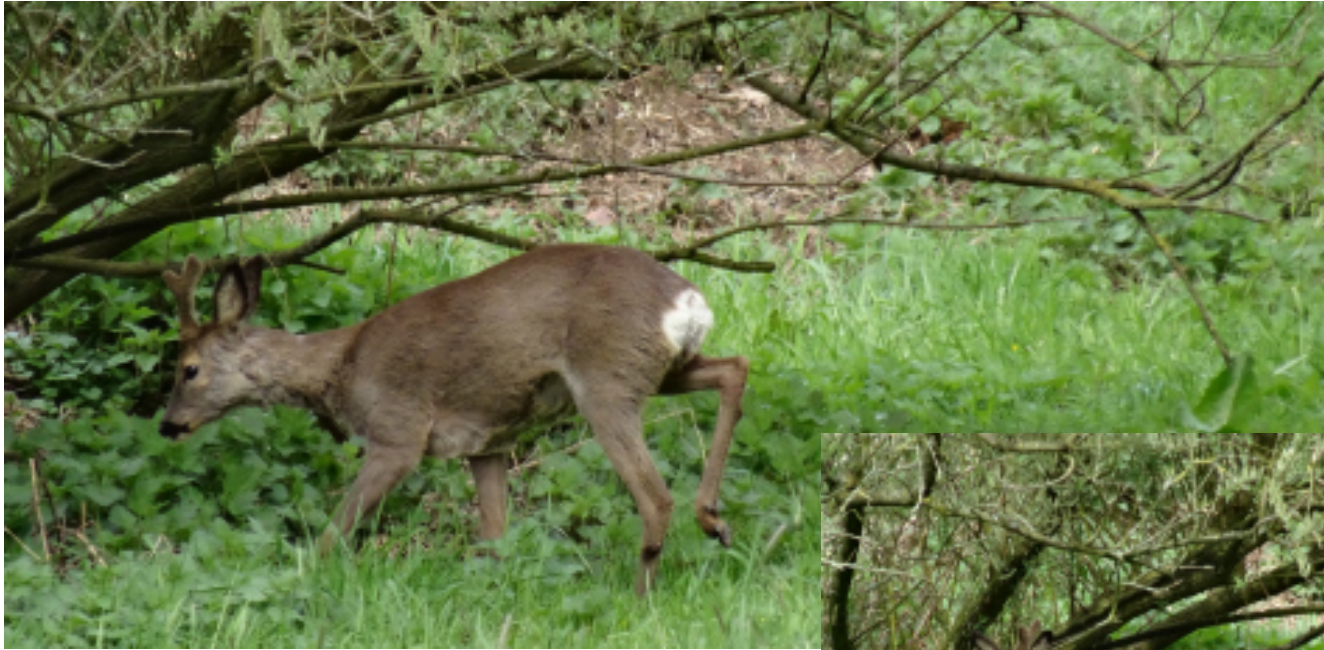
Ein Rehbock im Osterlager an der Hase auf Höhe des Thingplatzes