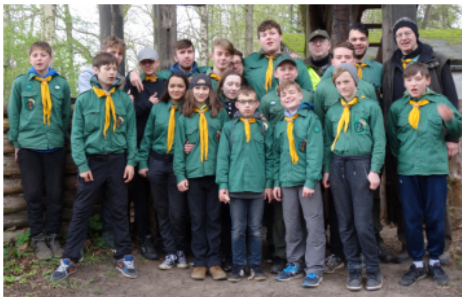
Die Osterlager- teilnehmer