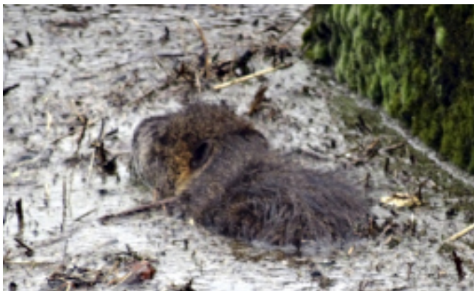
Nutria am Zufluss zu den 'Herzteichen'