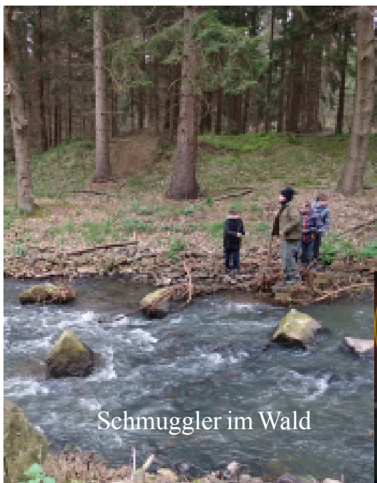
Schmuggler im Wald