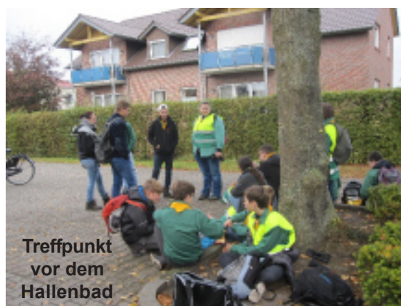
Treffpunkt vor dem Hallenbad

Ebenfalls wurden viele andere Dinge unternommen: Verschiedene Geländespiele, Wanderungen, usw. Wir spielten z.B. das Bändchenspiel, wobei zwei Mannschaften versuchen sich gegenseitig das Gummiband, welches man entweder am linken oder rechten Arm trägt, wegzunehmen. Darauf bereiteten wir uns besonders gut vor, weil