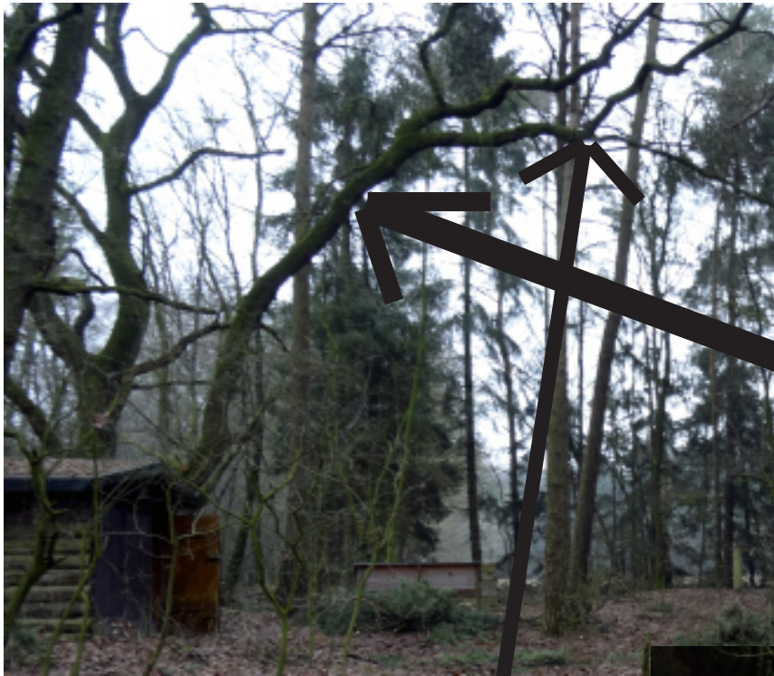
Die betroffene Eiche

Der Blick täuscht: Keine Kiefer hält die Eiche mehr. Der Fall ist nur noch eine Frage der Zeit.